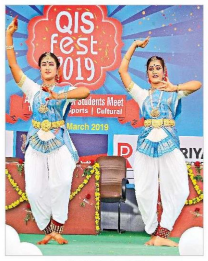
విద్యాల్థినుల సంప్రదాయ నృత్య ప్రదర్శన